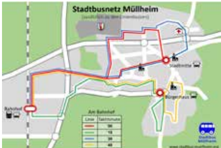
Stadtbusnetzkonzept des Arbeitskreises Mobilität